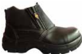
BOTA DE SEGURIDAD FENIX CAFE 53242515