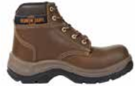
BOTA CLÁSICA DE SEGURIDAD SUELA EN TPU 93502341