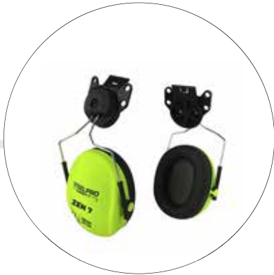
PROTECTOR AUDITIVO PARA INSERTAR EN CASCO ZEN7 HV NRR 24dB 502262