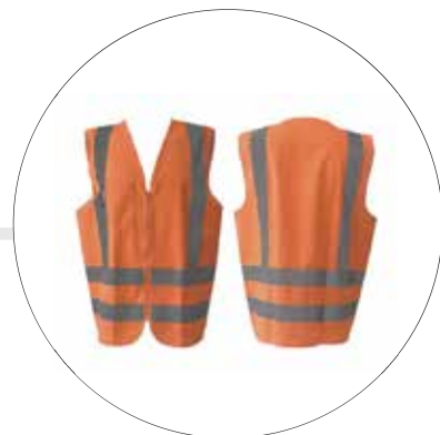
CHALECO REFLECTIVO CITYLUX NARANJA 452051440480