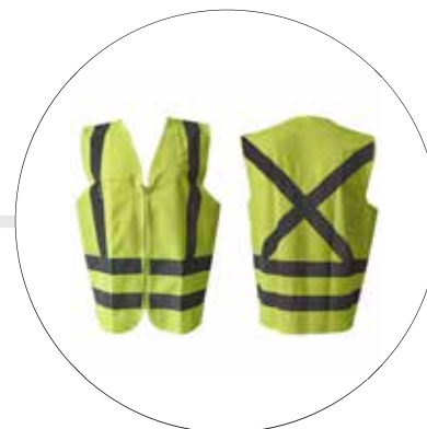
CHALECO REFLECTIVO CITYLUX VERDE 452051440481