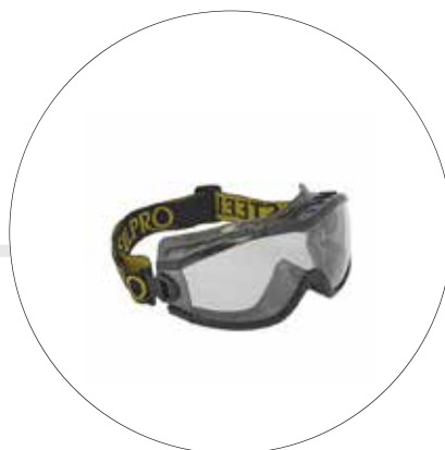
MONOGAFAS EVEREST GRIS ANTIFOG ANSI Z87 352450080145