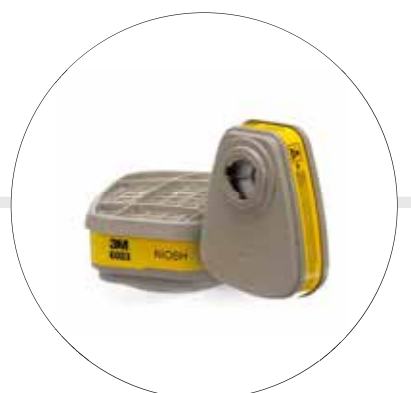
CARTUCHO GASES ACIDOS Y VAPORES ORGÁNICOS 6003