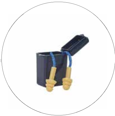
PROTECTOR AUDITIVO SILICONA NATURAL ESTUCHE LLAVERO NRR 26dB 201851310072