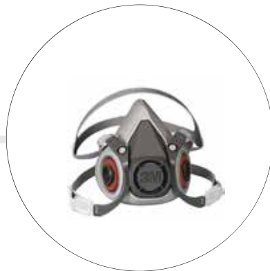
RESPIRADOR CONTRA GASES Y VAPORES 6200