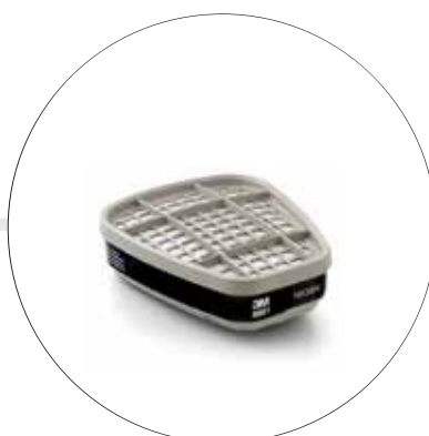
CARTUCHO CONTRA VAPORES ORGÁNICOS 6001