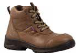
BOTA DE SEGURIDAD PARA DAMA TIPO INGENIERO 40062541