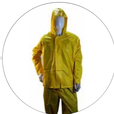
CONJUNTO IMPERMEABLE DE CHAQUETA PANTALON