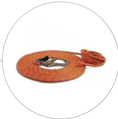
LÍNEAS DE VIDA VERTICAL DE DISTINTAS LONGITUDES A-0367-13