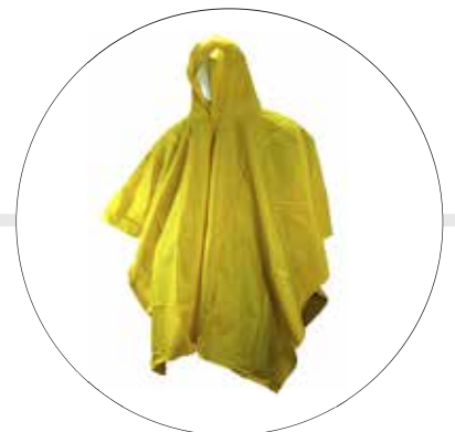
PONCHO IMPERMEABLE CON CAPUCHA