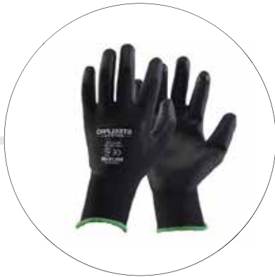
GUANTES DE POLIESTER Y POLIURETANO