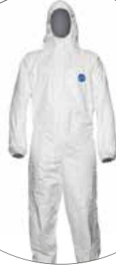
OVEROL DESECHABLE TYVECK 400 DUPONT TY122SWH-LG