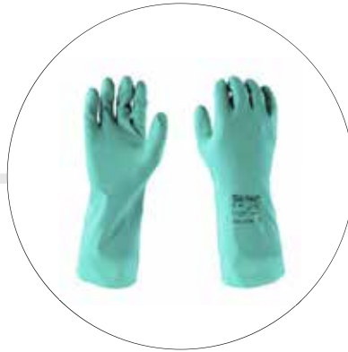
GUANTE DE NITRILO 13" SOLVEX