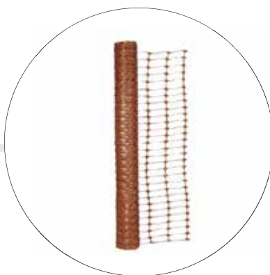
ROLLO DE MALLA NARANJA PARA DEMARCACIÓN 502400940005