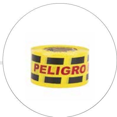
CINTA DE DEMARCACIÓN BICOLOR ROLLO X 50 MTS CI-DE-AM/NEG