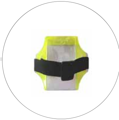
BRAZALETE PORTA CARNET BR-PC