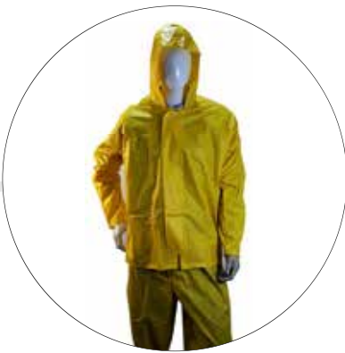
CONJUNTO IMPERMEABLE DE CHAQUETA PANTALON 500-20-AM