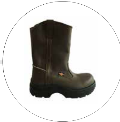
BOTA PETROLERA SUELA EN POLIURETANO CON FORRO 53512215