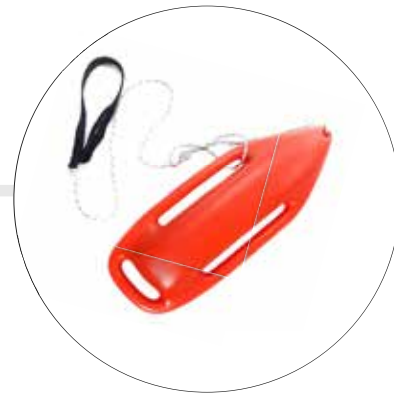
TORPEDO SALVAVIDAS DE 24" TOR-SA