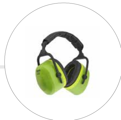
PROTECTOR AUDITIVO TIPO COPA JUMBO DIADEMA ACOLCHADA NRR 28dB 500560