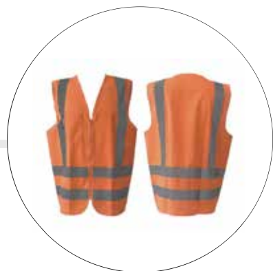
CHALECO REFLECTIVO CITYLUX NARANJA 452051440480