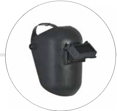
CARETA SOLDADOR APOLO 201400120060