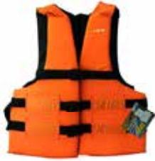
CHALECO SALVAVIDAS TRES CORREAS CH-SA