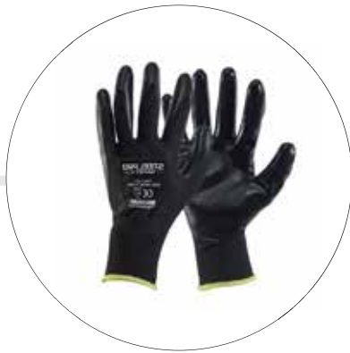
GUANTE MULTIFLEX POLIESTER NITRIL 501193