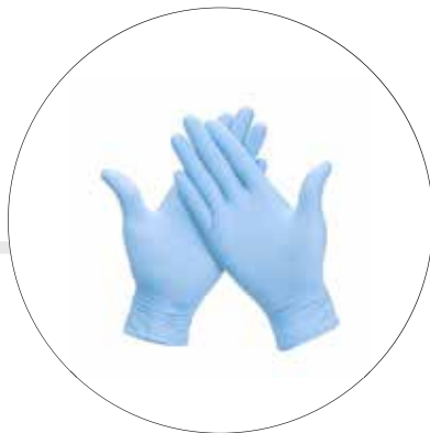
GUANTES DESECHABLES DE NITRILO