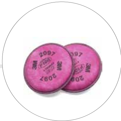
CARTUCHO PARA BAJAS CONCENTRACIONES DE GASES HUMOS DE SOLDADURA 2097