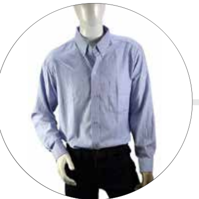
CAMISA EN DRIL CAM-DRI-ML-HOM-LE-AZ