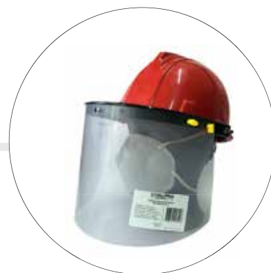
CASCO + BASCULANTE + VISOR CA-BA-VI