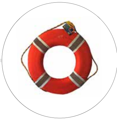
ARO SALVAVIDAS DE 24" G24