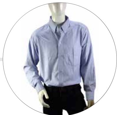
CAMISA EN DRIL CAM-DRI-ML-HOM-LE-AZ