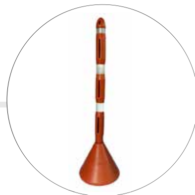
SEÑALIZADOR VIAL TUBULAR ALIEN 3S-1.27 MTS