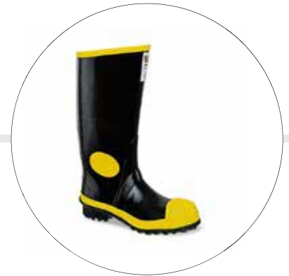
BOTA WORKMAN SAFETY WATERPROOF NEGRA 2030090