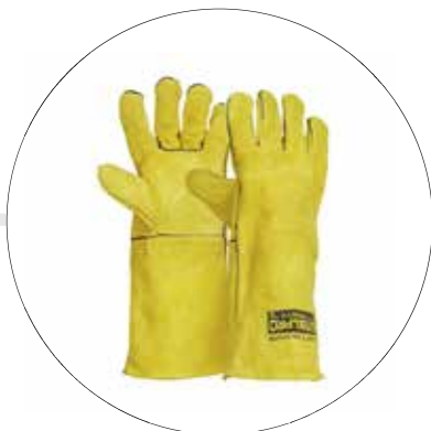
GUANTE SOLDADOR AMRILLO DE 16