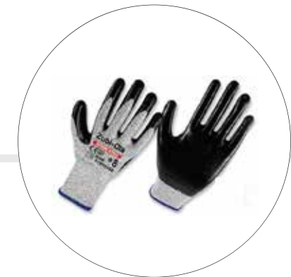
GUANTES FIBRA UHMWPE, RECUBIERTOS EN NITRILO • DIP NORMAL • NIVEL 5 • "EXTREME NITRILO"