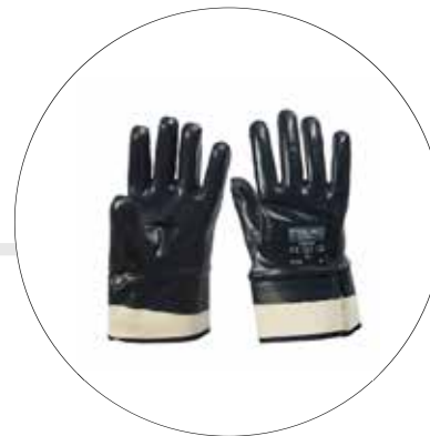
GUANTE NITRILSAFE LISO PUÑO SEGURIDAD TFCB T 9