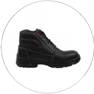
BOTA FENIX DE SEGURIDAD OPERATIVA PARA DAMA 40092521