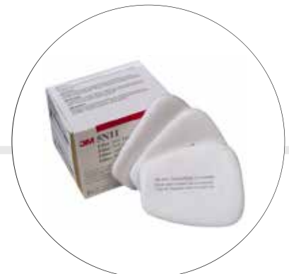
PREFILTRO PARA MATERIAL PARTICULADO 5N11