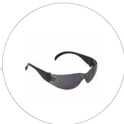
GAFAS DE PROTECCIÓN SPY 901259140245