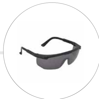
LENTE NITRO II GRIS AF ANSI Z87+ CON CORDÓN 351251160340