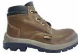
BOTA SEGURIDAD LABORAL SUELA EN POLIURETANO HUELLA PARA TORRES 24202341