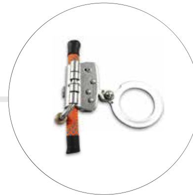
FRENO PARA CUERDA DE 13 MM 15070 - 1