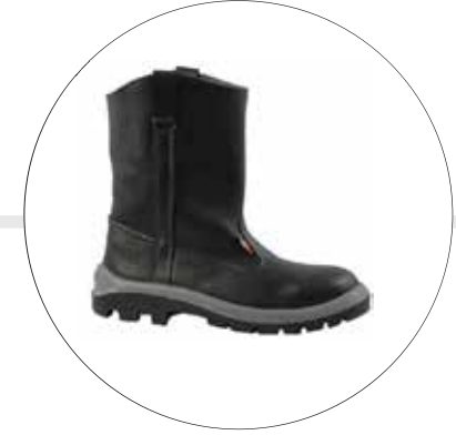
BOTA SOLDADOR SUELA INYECTADA EN CAUCHO Y POLIURETANO 33512231