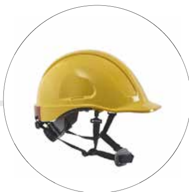
CASCO TIPO II MOUNTAIN CERTIFICADO 200350270035