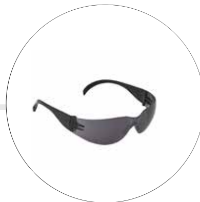
GAFAS DE PROTECCIÓN SPY 901259140245