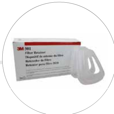
RETENEDOR PARA PREFILTRO 3M 501