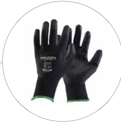
GUANTES DE POLIESTER Y POLIURETANO 501190