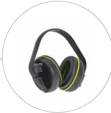
PROTECTOR AUDITIVO TIPO COPA SAMURAI 201851300069