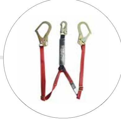
ESLINGA DOBLE TERMINAL ECO DE 1.8 501062