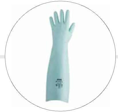
GUANTE DE NITRILO SOLVEX DE 18"