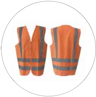
CHALECO REFLECTIVO CITYLUX NARANJA 452051440480