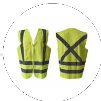
CHALECO REFLECTIVO CITYLUX VERDE 452051440481