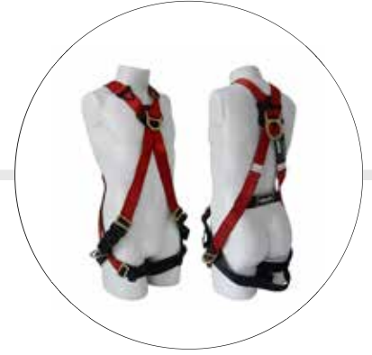
ARNÉS CRUZADO ECO ROJO 501061