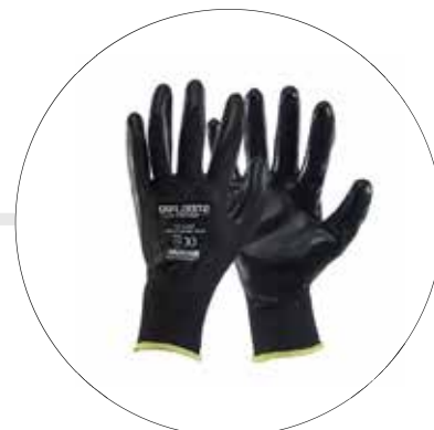
GUANTE MULTIFLEX POLIESTER NITRIL 501193