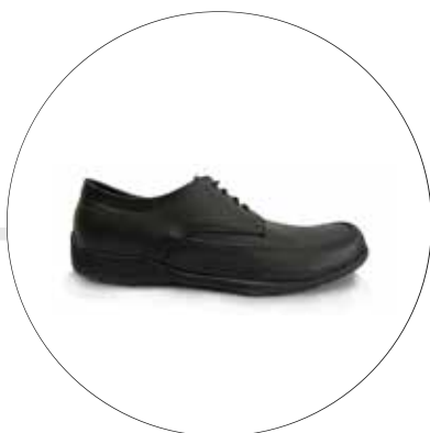
CALZADO PARA CAMAREROS 4215-S-N