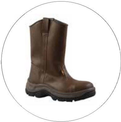
BOTA PETROLERA DE SEGURIDAD SUELA EN TPU 93512241