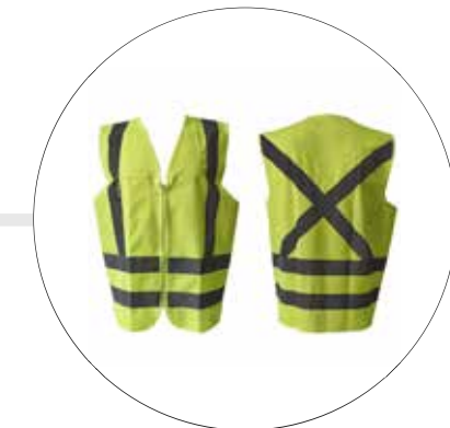
CHALECO REFLECTIVO CITYLUX VERDE 452051440481