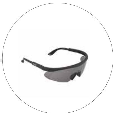
GAFAS DEMON 352450500020