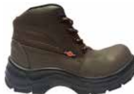
BOTA DE SEGURIDAD FENIX CON PLANTILLA ANTIPUNZON 23227521