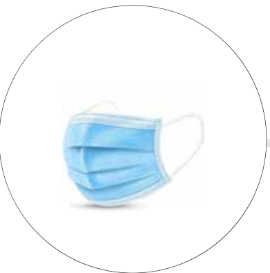
TAPABOCAS DESECHABLES Tapabocas 0lg x 50