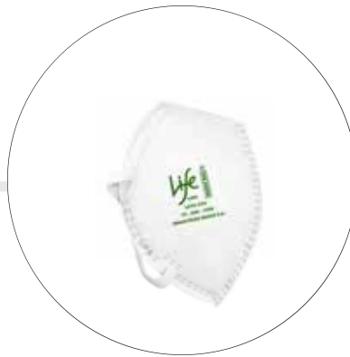
RESPIRADOR CONTRA MATERIAL PARTICULADO N95 LIFE 1095