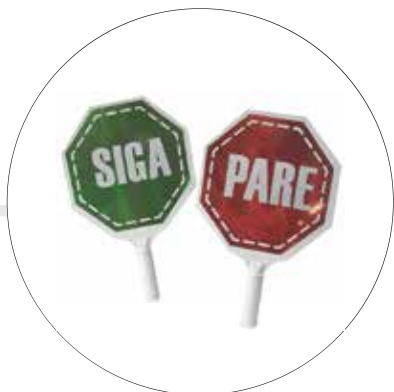
PALETA PARE-SIGA PR30