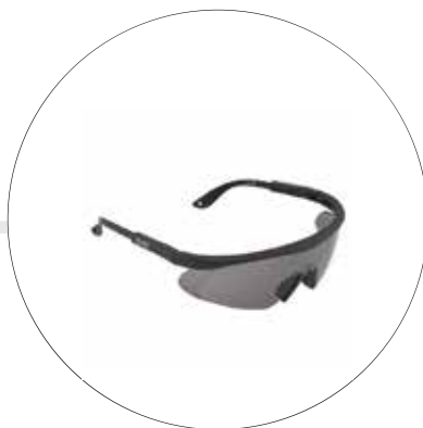
GAFAS DEMON 352450500020