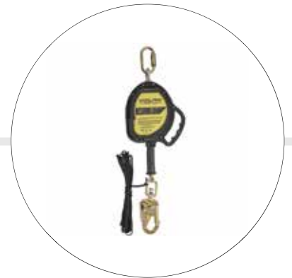
BLOQUE RETRÁCTIL DE ACERO CON CABLE EN ACERO DE 9 MTS 500878