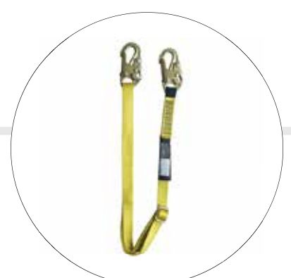
ESLINGA POSICIONAMIENTO 1.80M GRADUABLE 500843