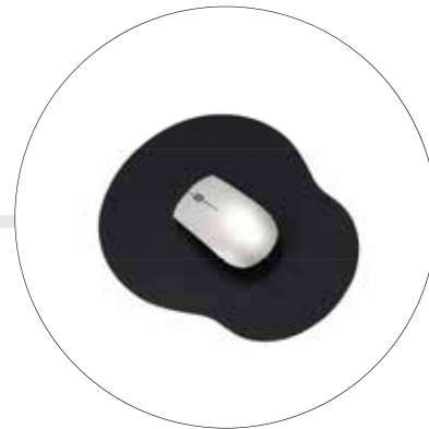
PAD MOUSE PLANO EN JERSEY 1093