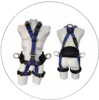
ARNES PARA RESCATE 5 ARGOLLAS A-0344R