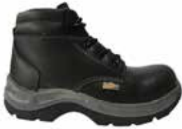
BOTA DE SEGURIDAD LABORAL SUELA EN TPU 93202321