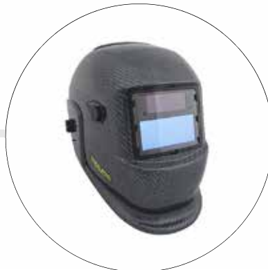
CARETA SOLDADOR OPTECH VISOR GRADUABLE 901809220333