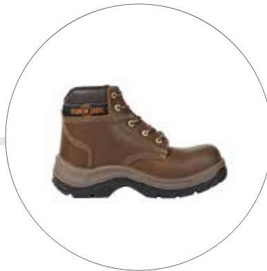
BOTA CLÁSICA DE SEGURIDAD SUELA EN TPU 93502341