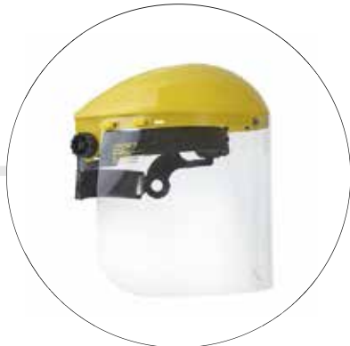
CARETAS DE ESMERILAR 201801160452