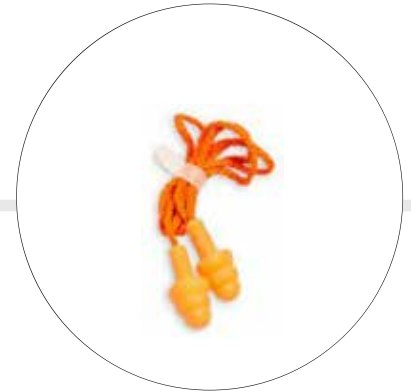
PROTECTOR AUDITIVO DE INSERCIÓN A-2058