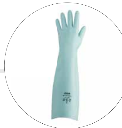
GUANTE DE NITRILLO SOLVEX DE 18" 480