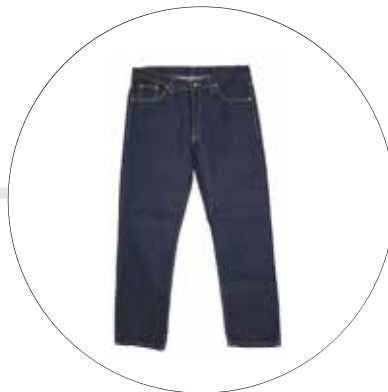
JEANJEAN DE TRABAJO JE-HOM-LE