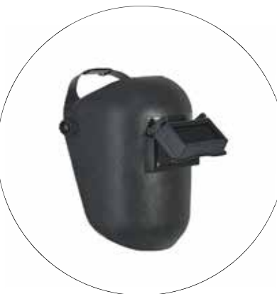
CARETA SOLDADOR APOLO 201400120060