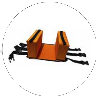
INMOVILIZADOR DE CABEZA EN ESPUMA IN-CA-CA