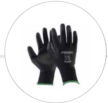
GUANTE MULTIFLEX NYLON PU 301000780110