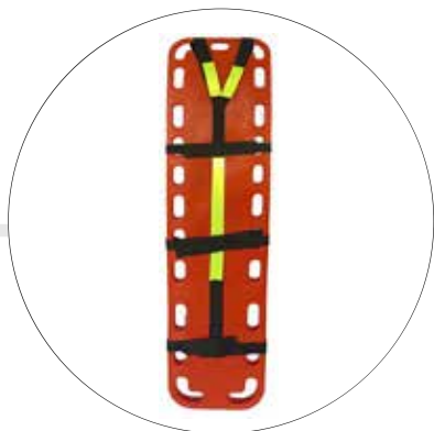
CAMILLA NARANJA TRANSLÚCIDA CA-PO-NA