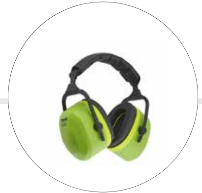
PROTECTOR AUDITIVO TIPO COPA JUMBO DIADEMA ACOLCHADA NRR 28dB 500560