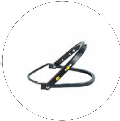
ADAPTADOR PLASTICO PORTA VISOR PARA CASCO 201800040049