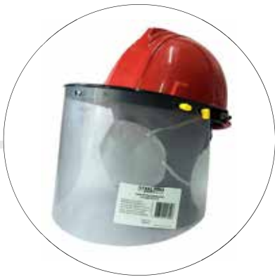
CASCO + BASCULANTE + VISOR CA-BA-VI