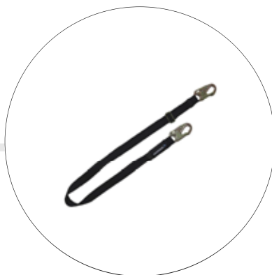
ESLINGA DE POSCIONAMIENTO GRADUABLE IGNIFUGA A-0363GK