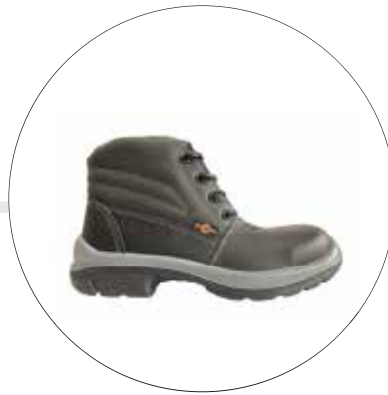
BOTA DE SEGURIDAD FENIX CON PLANTILLA ANTIPUNZON 23227521