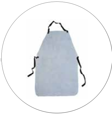
DELANTAL EN CARNAZA DC