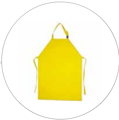
DELANTAL EN PVC CALIBRE 25 337-30