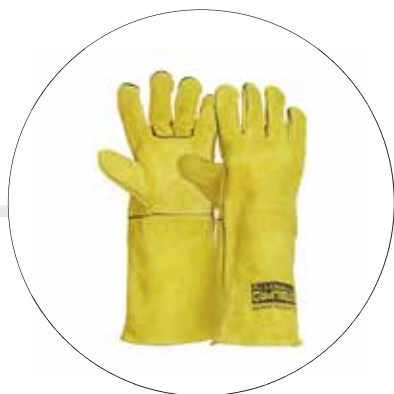
GUANTE SOLDADOR AMRILLO DE 16 500444