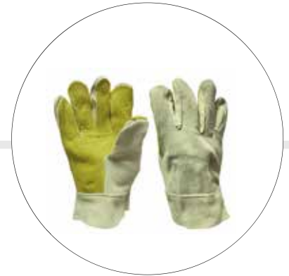
GUANTE DE CARNAZA REFORZADO EN VAQUETA CORTO CRVC