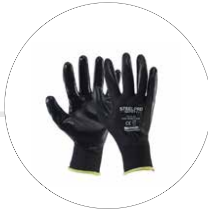
GUANTE MULTIFLEX POLIESTER NITRIL 301000781002