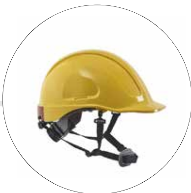
CASCO TIPO II MOUNTAIN CERTIFICADO 200350270035