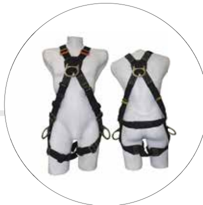
ARNES SOLDADOR REATA IGNIFUGA A-0350 K