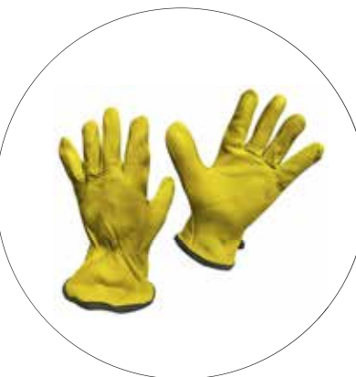
GUANTE TIPO INGENIERO ING-C