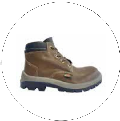
BOTA SEGURIDAD LABORAL SUELA EN POLIURETANO HUELLA PARA TORRES 24202341