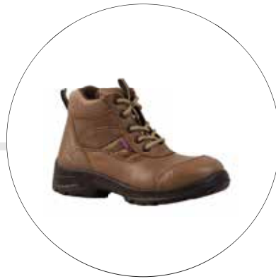
BOTA DE SEGURIDAD PARA DAMA TIPO INGENIERO 40062541