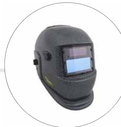
CARETA SOLDADOR OPTECH VISOR GRADUABLE 901809220333