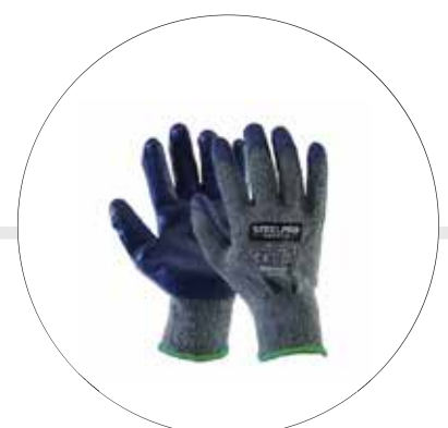
GUANTE DE POLYESTER RECUBIERTO EN LATEX ECO AZUL 501184