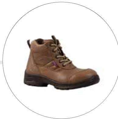
BOTA DE SEGURIDAD PARA DAMA TIPO INGENIERO 40062541