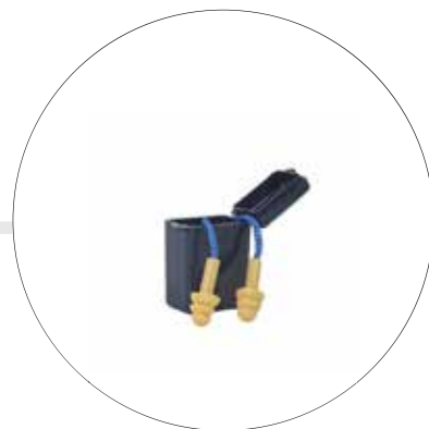
PROTECTOR AUDITIVO DE INSERCIÓN REFLEX 201851310073