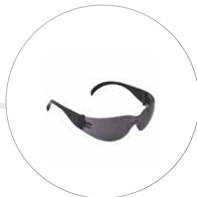
GAFAS DE PROTECCIÓN SPY 901259140245