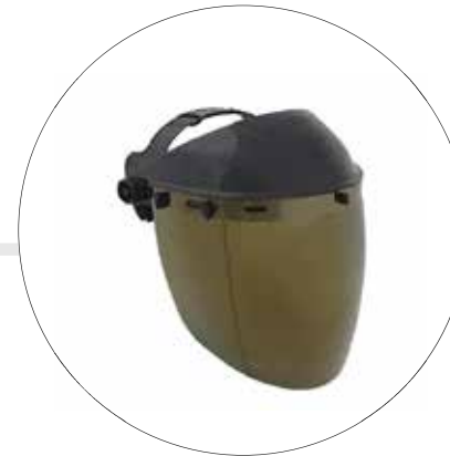
CARETA ROCKET POLICARBONATO AF IR 5.0 DORADO | (RAD. CALORICA) 500993