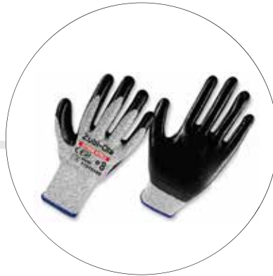
GUANTES ANTICORTE FIBRA UHMWPE RECUBIERTOS EN NITRIL DIP NORMAL • NIVEL 5 • EXTREME NITRIL 11919110