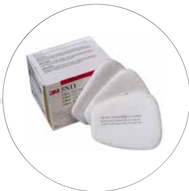
PREFILTRO PARA MATERIAL PARTICULADO 5N11