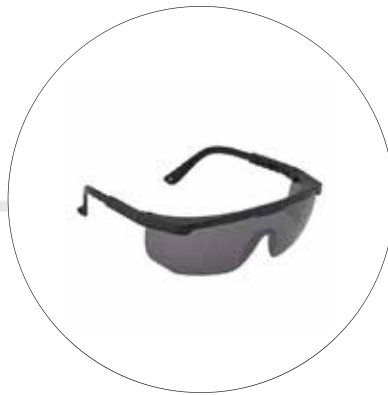
LENTE NITRO II GRIS AF ANSI Z87+ CON CORDÓN 351251160340