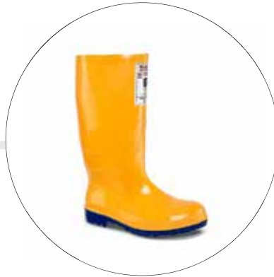
WORKMAN SAFETY DIELECTRICA CERTIFICADA 2420026