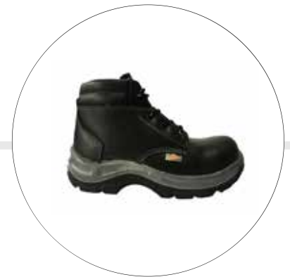
BOTA DE SEGURIDAD LABORAL SUELA INYECTADA EN TPU 93202321