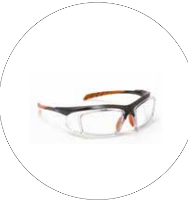
GAFA MERCURIO DE PROTECCION PARA LENTE FORMULADO K633RX