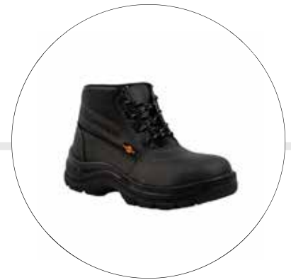
BOTA DE SEGURIDAD 53222565