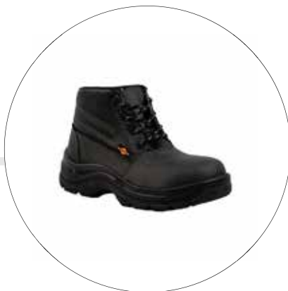
BOTA DE SEGURIDAD OPERATIVA LIVIANA 53222565