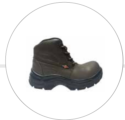
BOTA DE SEGURIDAD FENIX CAFE 53242565