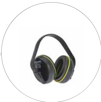
PROTECTOR AUDITIVO TIPO COPA SAMURAI 201851300069