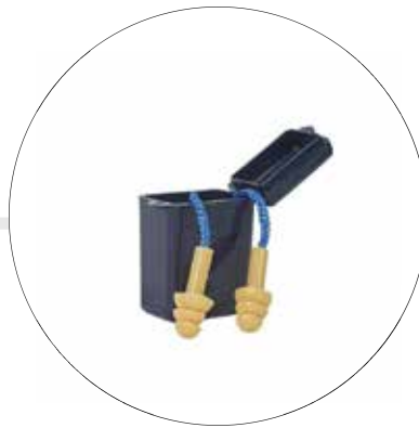
PROTECTOR AUDITIVO SILICONA NATURAL ESTUCHE LLAVERO NRR 26dB 201851310072