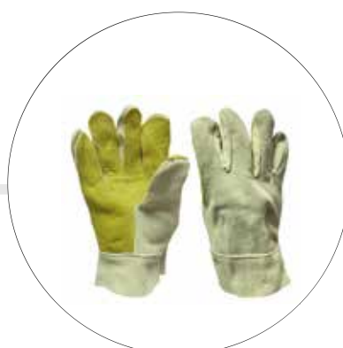
GUANTE DE CARNAZA REFORZADO EN VAQUETA CRVC