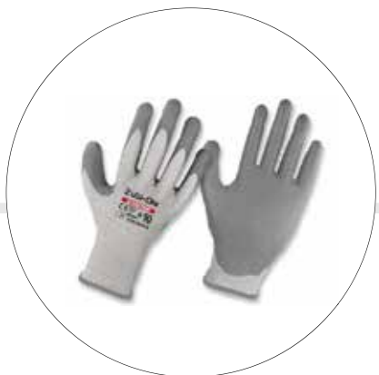
GUANTES ANTICORTE FIBRA UHMWPE RECUBIERTOS EN POLIURETANO • DIP NORMAL • NIVEL 5 • ULTRAEXTREME 11980075