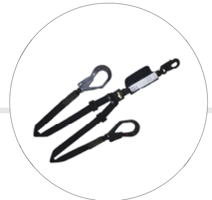
ESLINGA DOBLE TERMINAL IGNIFUGA DIELECTRICA A-0358DGK