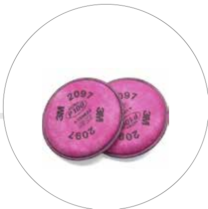
CARTUCHO PARA BAJAS CONCENTRACIONES DE GASES HUMOS DE SOLDADURA 2097