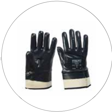
GUANTE NITRILSAFE LISO PUÑO SEGURIDAD TFCB T 9 500504