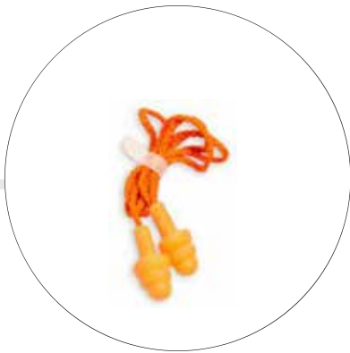
PROTECTOR AUDITIVO DE INSERCIÓN A-2058