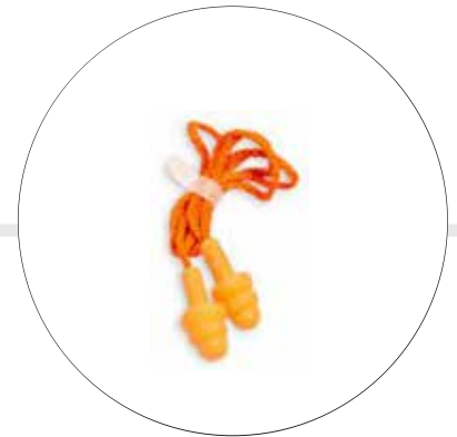
PROTECTOR AUDITIVO DE INSERCIÓN A-2058