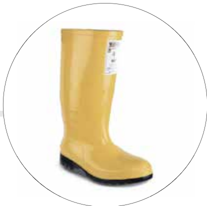
BOTA WORKMAN SUPER SAFETY OIL RESISTANT 2430026