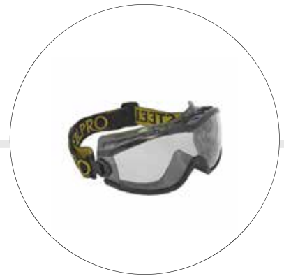
MONOGAFA EVEREST GRIS ANTIFOG ANSI Z87 352450080145