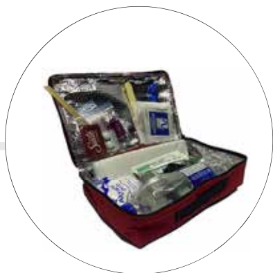
BOTIQUÍN TERMICO 18 ELEMENTOS BOT-18 ELEM