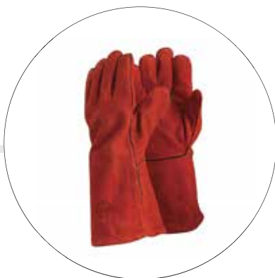
GUANTE SOLDADOR NARANJA DE 14" 300850670009