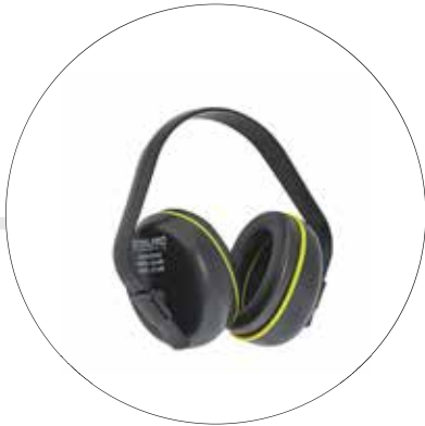
PROTECTOR AUDITIVO TIPO COPA SAMURAI 201851300069