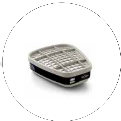
CARTUCHO CONTRA VAPORES ORGÁNICOS 6001