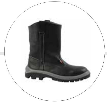
BOTA SOLDADOR SUELA INYECTADA EN CAUCHO Y POLIURETANO 33512231