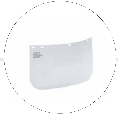
VISOR EN POLICARBONATO RIBETE ALUM. 8 X 16 201800280048