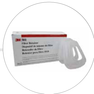
RETENEDOR PARA PREFILTRO 3M 501