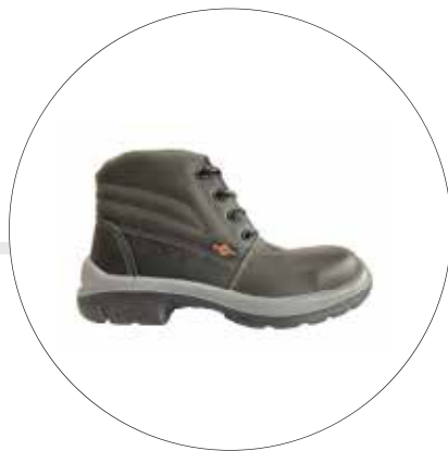
BOTA DE SEGURIDAD LIVIANA TIPO OPERARIO 23222561