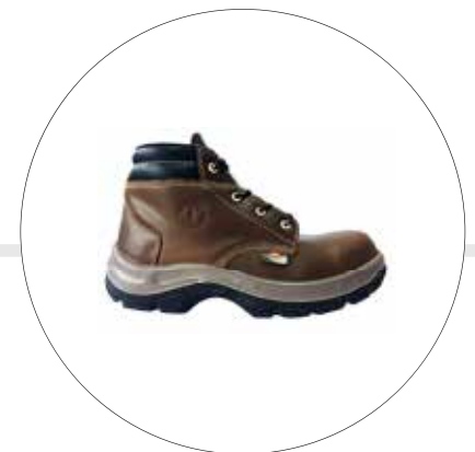
BOTA DE SEGURIDAD LABORAL EN CUERO SEMIGRASO, SUELA TPU 93202341