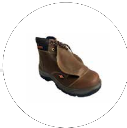
BOTA DE SEGURIDAD PROTECTOR METATARSAL 93842341