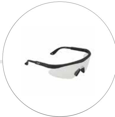
GAFAS DE SEGURIDAD DEMON LENTE CLARO 352450500019