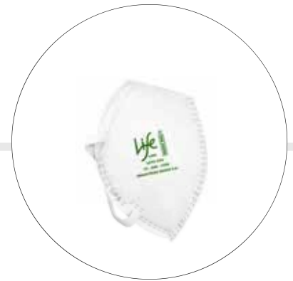
RESPIRADOR CONTRA MATERIAL PARTICULADO N95 LIFE 1095