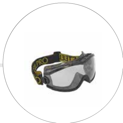
MONOGAFA ZEX LENTE CLARO ANTIEMPAÑANTE 3524501