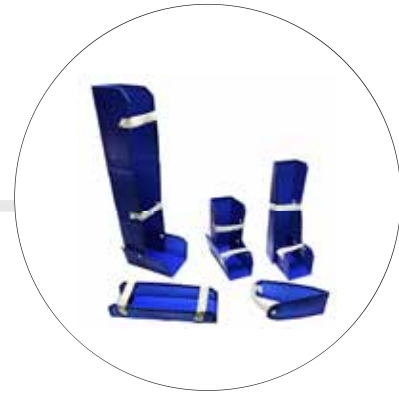
KIT DE INMOVILIZADORES DE EXTREMIDADES SUPERIORES E INFERIORES IN-EX-KIT