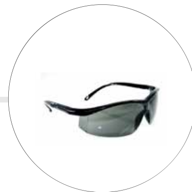
Gafa de protección creonte AL-277