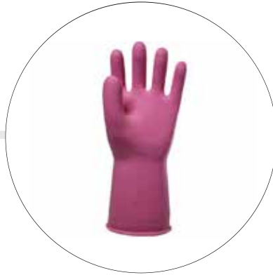
GUANTES DE CAUCHO DE DISTINTOS CALIBRES