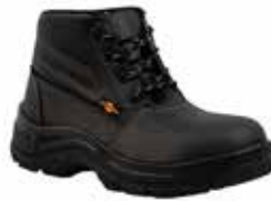
BOTA DE SEGURIDAD OPERATIVA LIVIANA 53222565