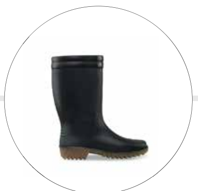
BOTAS MACHITA PARA DAMA 5900090