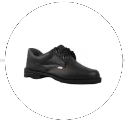
ZAPATO BOCHICA VULCANIZADO 10149261