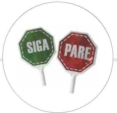
PALETA PARE-SIGA PR30