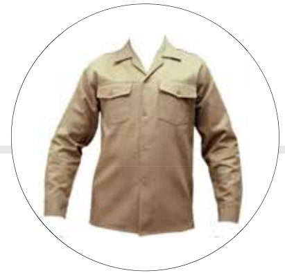
CAMISA EN DRIL CAM-DRI-ML-HOM-LE-AZ