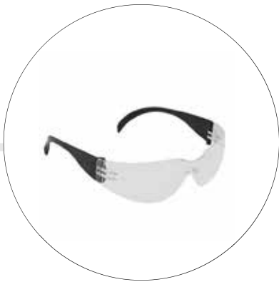
GAFAS DE PROTECCIÓN 352451590208