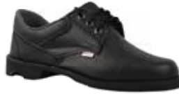
ZAPATO BOCHICA VULCANIZADO 10149261