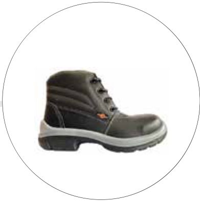
BOTA DE SEGURIDAD OPERATIVA LIVIANA SUELA BIDENSIDAD 23222561