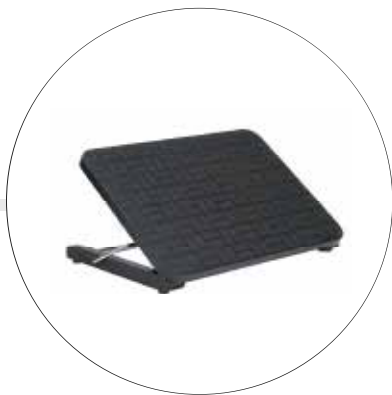
DESCANSAPIES CON MOVIMIENTO A 3 ALTURAS 0986