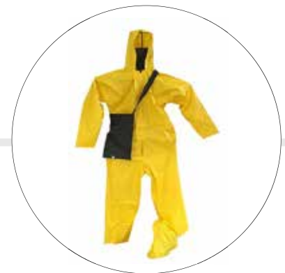
IMPERMEABLE PARA MOTOCICLISTAS