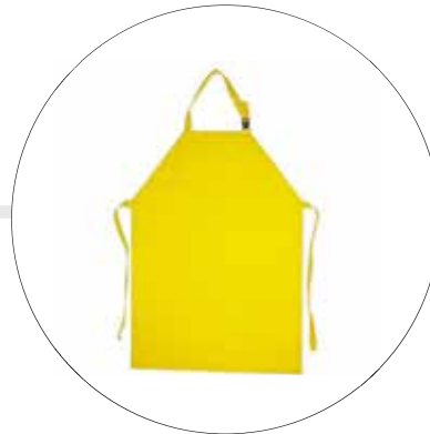
DELANTAL EN PVC DISTINTOS CALIBRE 337-20