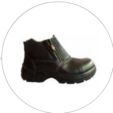
BOTA RIO DE SEGURIDAD SUELA EN POLIURETANO