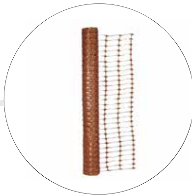
ROLLO DE MALLA NARANJA PARA DEMARCACIÓN 502400940005