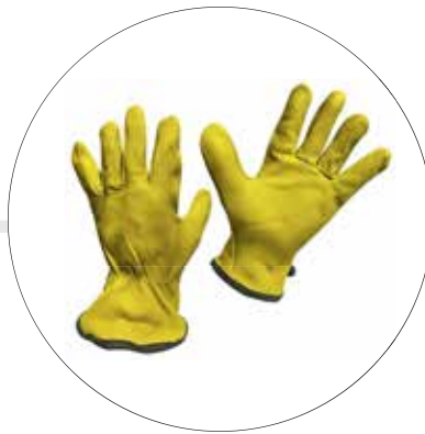
GUANTE TIPO INGENIERO ING-C