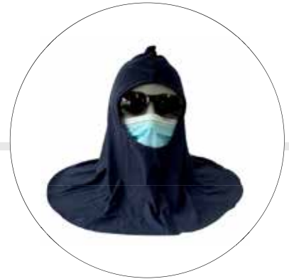
ESCAFANDRA EN ALGODÓN ES-AZ