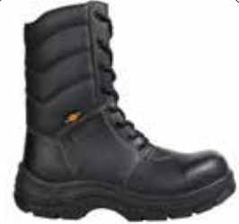
BOTA MILITAR COBRA 53182565