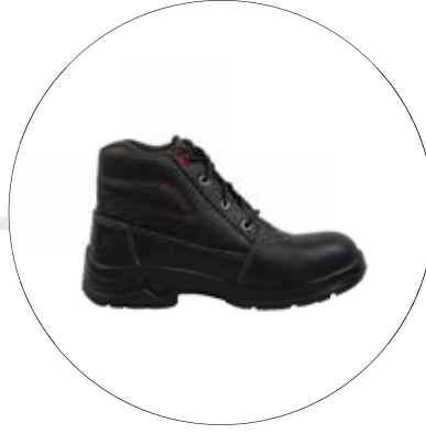
BOTA FENIX DE SEGURIDAD OPERATIVA PARA DAMA 40092521