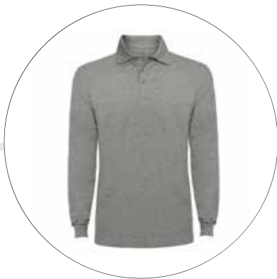
CAMISA TIPO POLO MANGA LARGA CA-TI-PO-ML