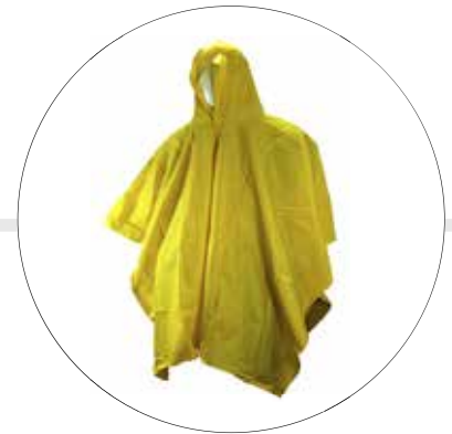
PONCHO IMPERMEABLE CON CAPUCHA 240-20