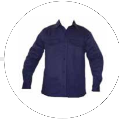
CAMISA EN DRIL CAM-DRI-ML-HOM-LE