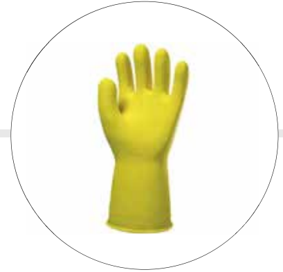
GUANTES DE CAUCHO DE DISTINTOS CALIBRES