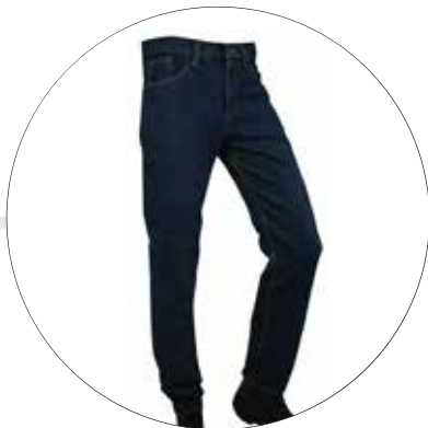
JEAN DE TRABAJO JE-HOM-LE