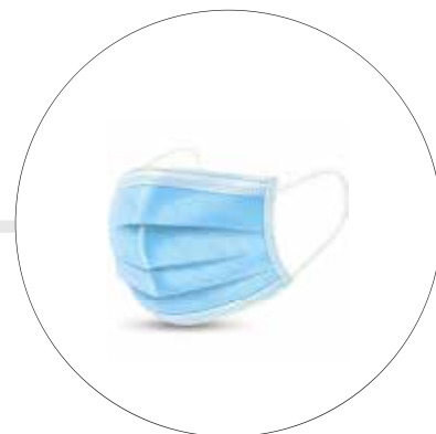
TAPABOCAS DESECHABLES Tapabocas 0lg x 50