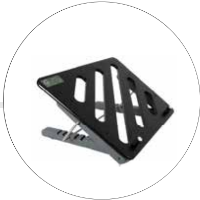
MESA PARA COMPUTADOR PORTATIL 0964