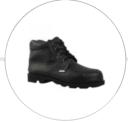
BOTA MONTAÑERA VULCANIZADA