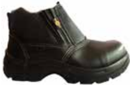
BOTA RIO DE SEGURIDAD SUELA EN POLIURETANO 53232515