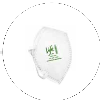
RESPIRADOR CONTRA MATERIAL PARTICULADO N95 LIFE 1095