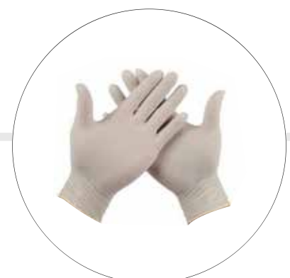
GUANTES DESECHABLES DE LÁTEX GULE003