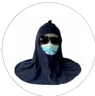
ESCAFANDRA EN ALGODÓN ES-AZ