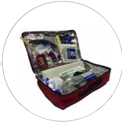
BOTIQUÍN TERMICO 18 ELEMENTOS BOT-18 ELEM