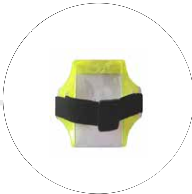
BRAZALETE PORTA CARNET BR-PC