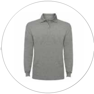
CAMISA TIPO POLO MANGA LARGA CA-TI-PO-ML