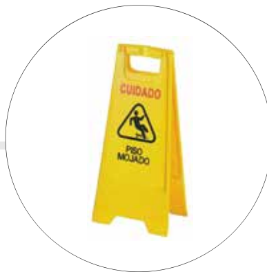
AVISO DE PISO TIPO TIJERA AV-TTP