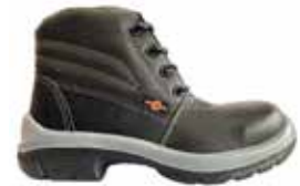
BOTA DE SEGURIDAD OPERATIVA LIVIANA SUELA BIDENSIDAD 23222561