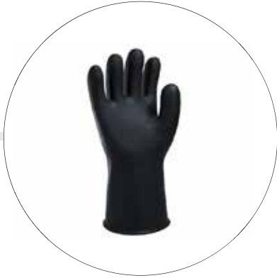
GUANTES DE CAUCHO DISTINTOS CALIBRES