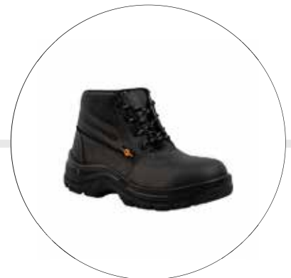
BOTA DE SEGURIDAD OPERATIVA LIVIANA