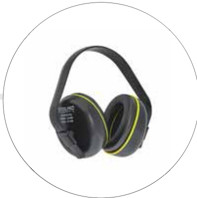
PROTECTOR AUDITIVO TIPO COPA SAMURAI 201851300069