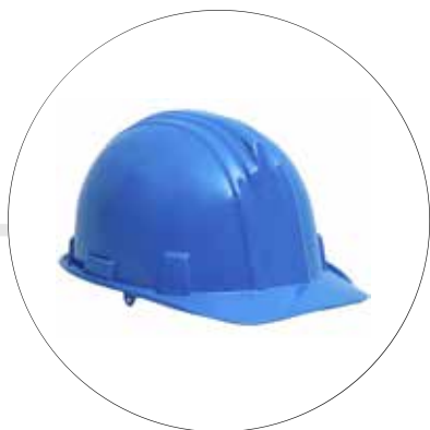
CASCO BUNKER CERTIFICADO A-1300SE