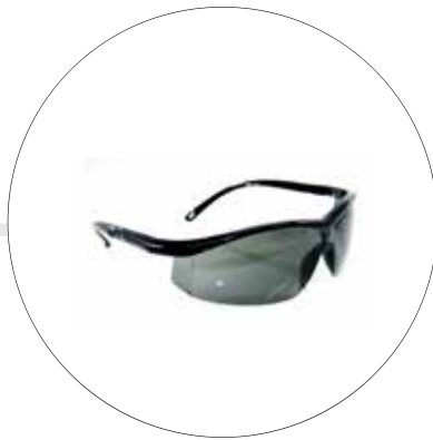
GAFAS DE PROTECCIÓN CREONTE AL-277