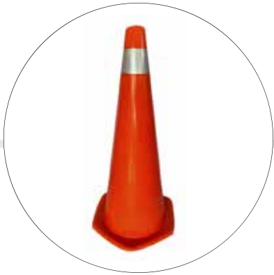
CONO VIAL DE 70 CMS CV 70 REX