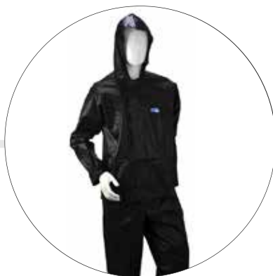
CONJUNTO IMPERMEABLE DE CHAQUETA PANTALON 500-20-NE