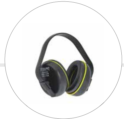
PROTECTOR AUDITIVO TIPO COPA SAMURAI 201851300069