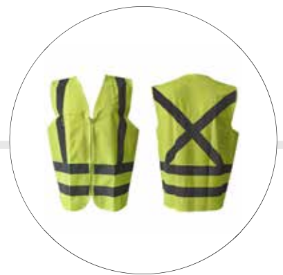
CHALECO REFLECTIVO CITYLUX VERDE 452051440481