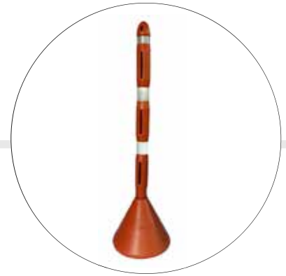
SEÑALIZADOR VIAL TUBULAR ALIEN 3S-1.27 MTS