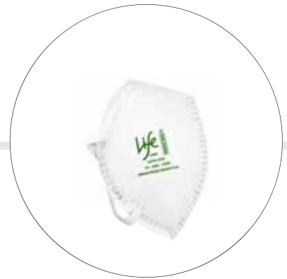
RESPIRADOR CONTRA MATERIAL PARTICULADO N95 LIFE 1095