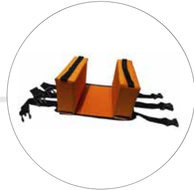
INMOVILIZADOR DE CABEZA EN ESPUMA IN-CA-CA