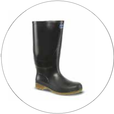
BOTA MACHA ALTA