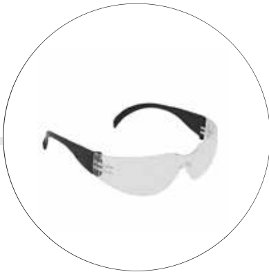
GAFAS DE PROTECCIÓN 352451590208