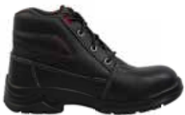
BOTA FENIX DE SEGURIDAD OPERATIVA PARA DAMA 40092521