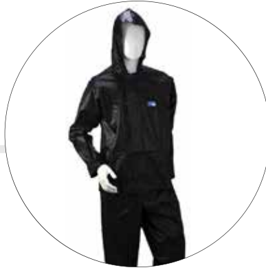
CONJUNTO IMPERMEABLE DE CHAQUETA PANTALON 500-20-NE