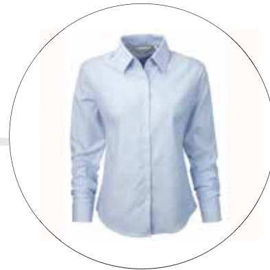
CAMISA EN OXFORD MANGA LARGA PARA DAMA CAM-OXF-ML-DAM-K