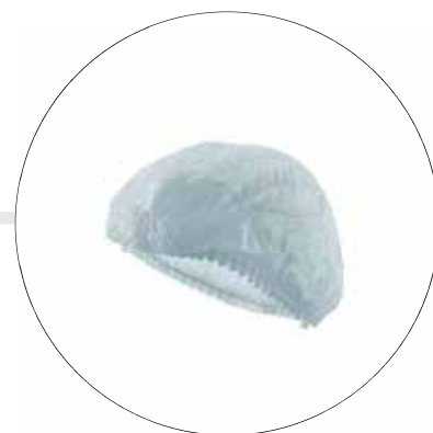
GORRO DESECHABLE GO-PLE-ORU-BL