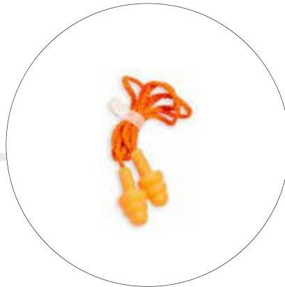
PROTECTOR AUDITIVO DE INSERCIÓN A-2058