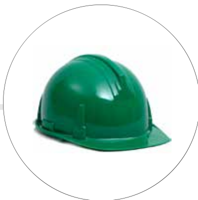
CASCO INDUSTRIAL A-1400