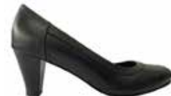
CALZADO PARA RECEPCIONISTA VIGILANCIA FEMENINO 4166