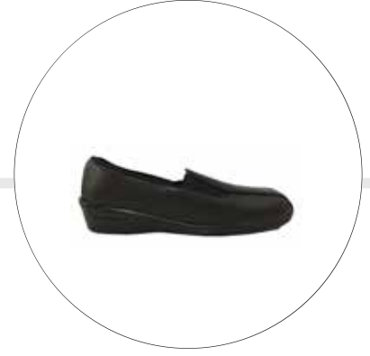
ZAPATO LADY DAMA SERVICIOS VARIOS 72059511