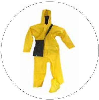
IMPERMEABLE PARA MOTOCICLISTAS 03-20