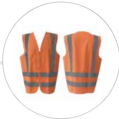
CHALECO REFLECTIVO CITYLUX NARANJA 452051440480