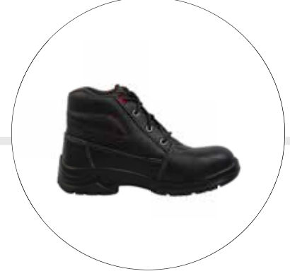
BOTA FENIX DE SEGURIDAD OPERATIVA PARA DAMA 40092521