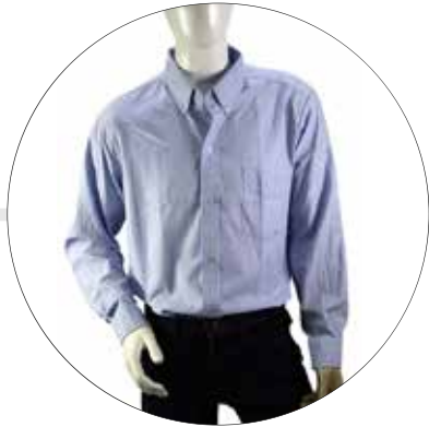
CAMISA EN OXFORD MANGA LARGA CAM-OXF-ML-HOM-K