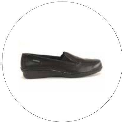
ZAPATO DAM ROMULO 0898