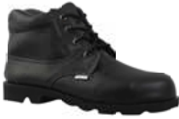
BOTA MONTAÑERA VULCANIZADA 10129261