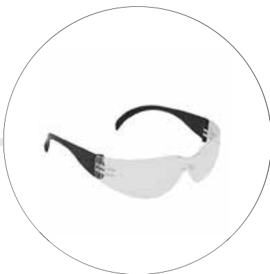
GAFAS DE PROTECCIÓN 352451590208