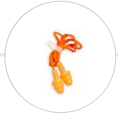
PROTECTOR AUDITIVO DE INSERCIÓN A-2058