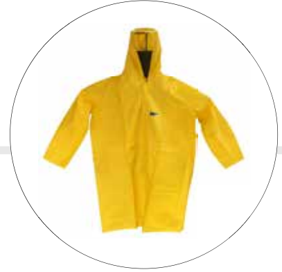
GABARDINA IMPERMEABLE CON CAPUCHA 220-20