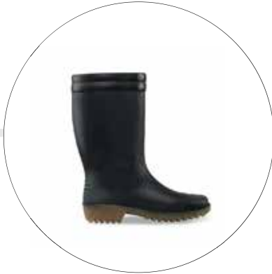
BOTAS MACHITA ARA DAMA