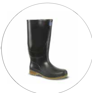
BOTA MACHA ALTA 2330090