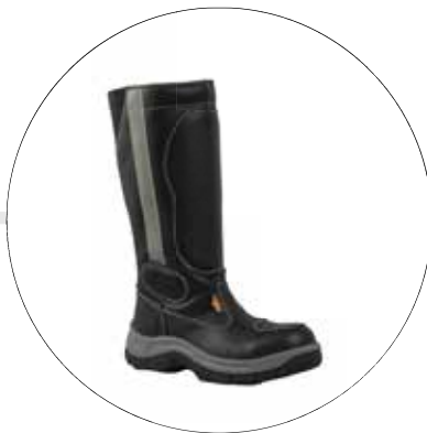
BOTA MOTOCICLISTA CAÑA ALTA 93102201