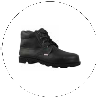
BOTA MONTAÑERA VULCANIZADA 10129261