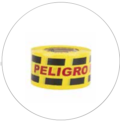
CINTA DE DEMARCAACION BICOLOR ROLLO X 50 MTS CI-DE-AM/NEG