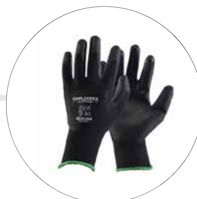
GUANTES DE POLIESTER Y POLIURETANO 501190