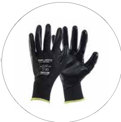
GUANTE MULTIFLEX POLIESTER NITRIL 501193