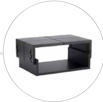
MESA GRADUABLE ELEVAMONITOR 1203