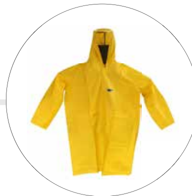
GABARDINA IMPERMEABLE CON CAPUCHA 220-20