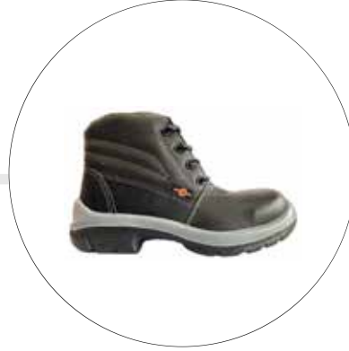
BOTA DE SEGURIDAD OPERATIVA LIVIANA SUELA BIDENSIDAD 23222561