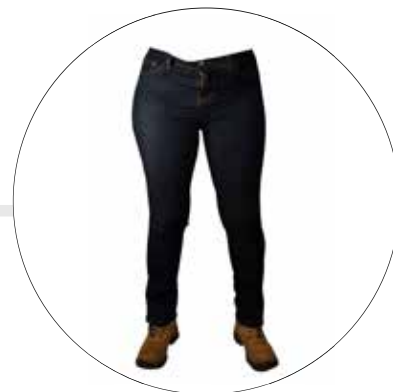
JEAN PARA DAMA STRECH JE-DAM-K