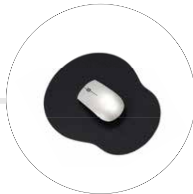
PAD MOUSE PLANO EN JERSEY 1093