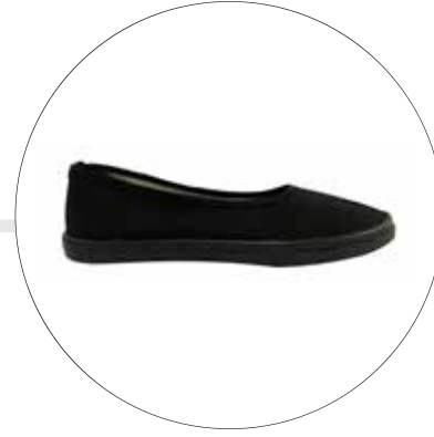
BALETA EN LONA TIPO OPERATIVO S-003NG35