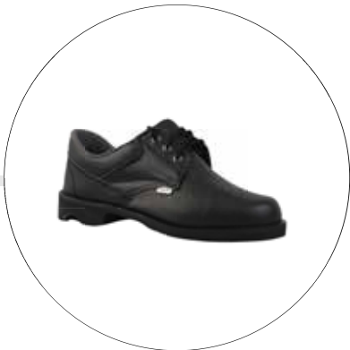
ZAPATO BOCHICA VULCANIZADO