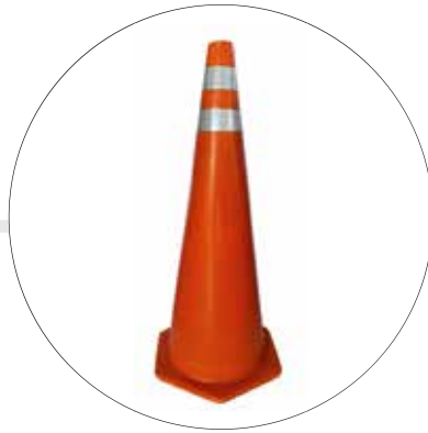
CONO VIAL DE 90 CMS CV 90 REX