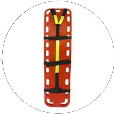
CAMILLA NARANJA TRANSLÚCIDA CA-PO-NA