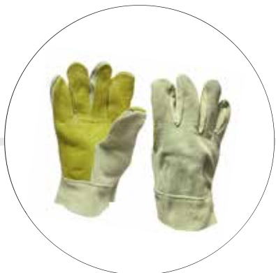
GUANTE CARNAZA REFORZADO ENVAQUETA