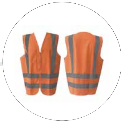
CHALECO REFLECTIVO CITYLUX NARANJA 452051440480