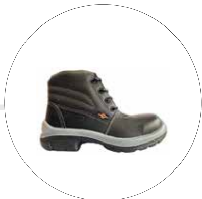
BOTA DE SEGURIDAD LIVIANA TIPO OPERARIO 23552565