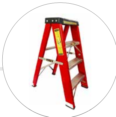
ESCALERAS DIELECTRICAS TF1.20