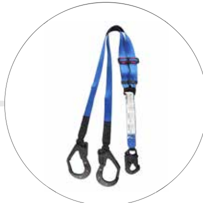
ESLINGA DE DOBLE TERMINAL DIELECTRICA