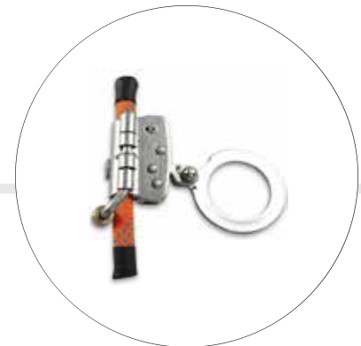
FRENO PARA CUERDA 13 MM