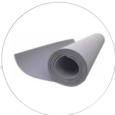
TAPETES DIELECTRICOS 00