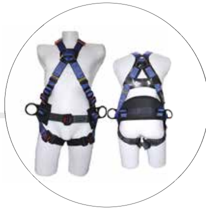
ARNES DIELECTRICO MULTIPROPOSITO CON SOPORTE LUMBAR