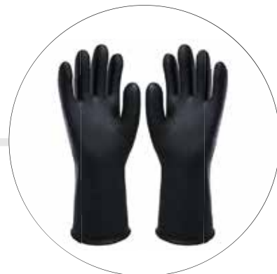
GUANTES DE CAUCHO DISTINTOS CALIBRES