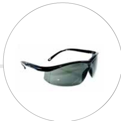
GAFAS DE SEGURIDAD CREONTE AL-277