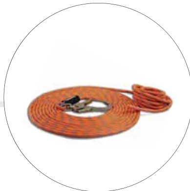
LÍNEAS DE VIDA VERTICAL DISTINTAS LONGITUDES