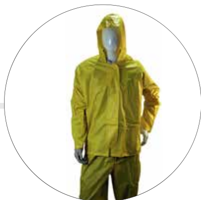
CONJUNTO IMPERMEABLE CHAQUETA PANTALON 500-20-AM