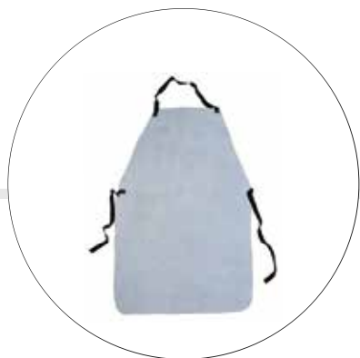
DELANTAL CARNAZA PARA SOLDADOR DC