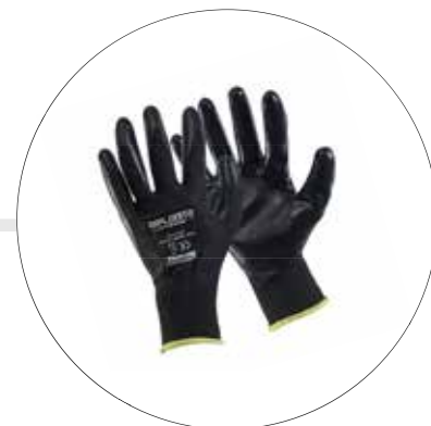
GUANTE MULTIFLEX POLIESTER NITRIL