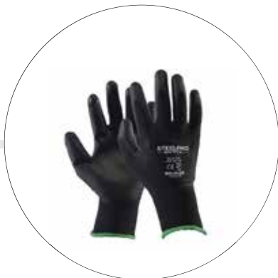
GUANTES DE POLIÉSTER Y POLIURETANO 501190