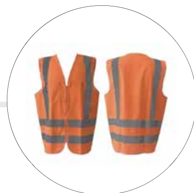
CHALECO REFLECTIVO CITYLUX NARANJA 452051440480