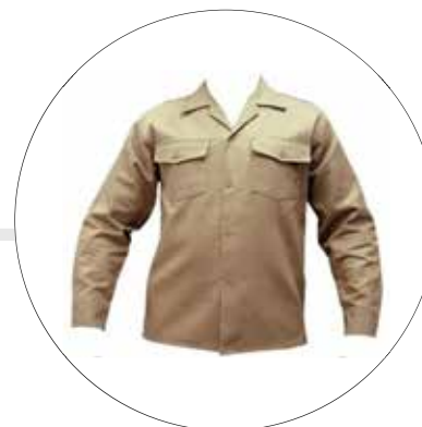
CAMISA EN DRIL CAM-DRI-ML-HOM-LE-AZ