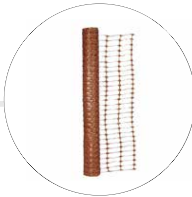
ROLLO DE MALLA NARANJA PARA DEMARCACIÓN 502400940005