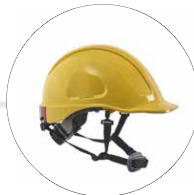
CASCO TIPO II MOUNTAIN CERTIFICADO | 200350270035