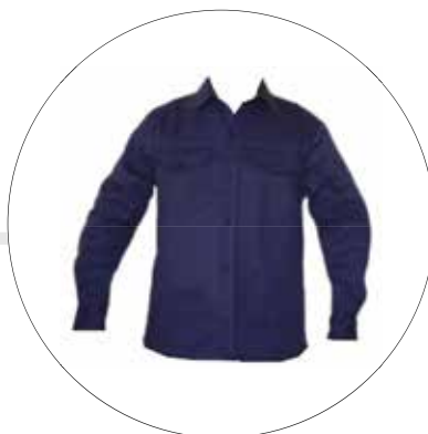
CAMISA EN DRIL CAM-DRI-ML-HOM-LE