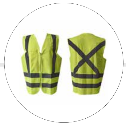
CHALECO REFLECTIVO CITYLUX VERDE 452051440481