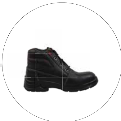
BOTA FENIX DE SEGURIDAD OPERATIVA PARA DAMA 40092521