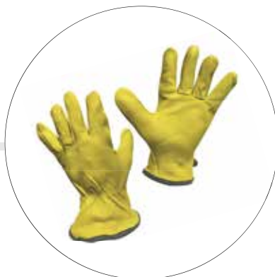
GUANTE TIPO INGENIERO