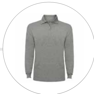
CAMISA TIPO POLO MANGA LARGA CA-TI-PO-ML