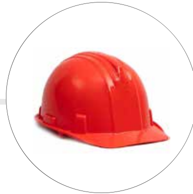
CASCO BUNKER CERTIFICADO I A-1300SE