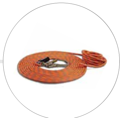
LÍNEAS DE VIDA VERTICAL DE DISTINTAS LONGITUDES A-0367-13