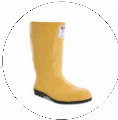
WORKMAN SAFETY DIELECTRICA CERTIFICADA 2420026