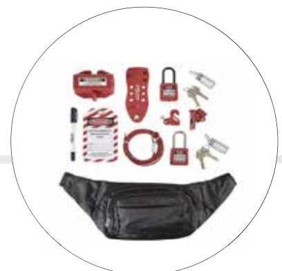
KIT BLOQUEO Y ETIQUETADO ELECTRICISTA 501355