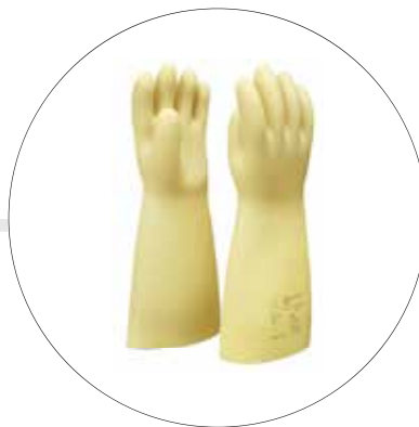
GUANTES DIELECTRICOS DISTINTOS VOLTAJES 00