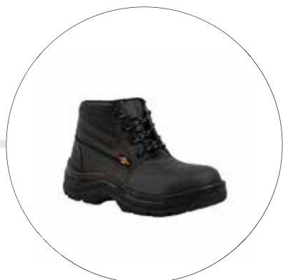
BOTA DE SEGURIDAD LIVIANA TIPO OPERARIO 53222565