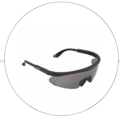
GAFAS DEMON 352450500020