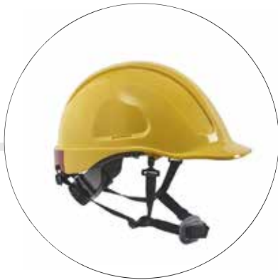
CASCO TIPO II MOUNTAIN CERTIFICADO 200350270035