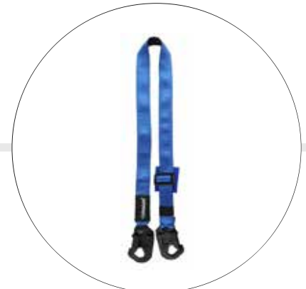
ESLINGA DE POSICIONAMIENTO DIELECTRICA