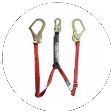
ESLINGA DOBLE TERMINAL ECO DE 1.8 501062