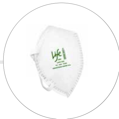
RESPIRADOR LIFE N95 APROBACION NIOSH