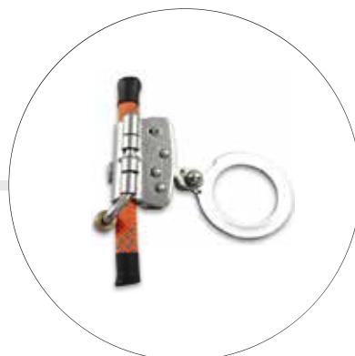
FRENO PARA CUERDA DE 13 MM 15070 - 1