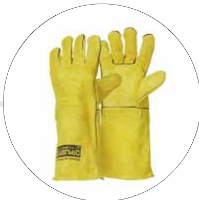
GUANTE SOLDADOR AMRILLO DE 16"