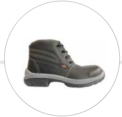
BOTA DE SEGURIDAD OPERATIVA LIVIANA | SUELA BIDENSIDAD 23222561