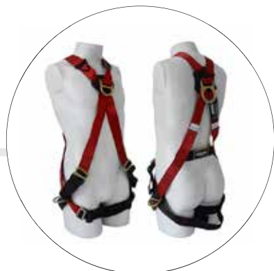
ARNES CRUZADO ECO ROJO 501061