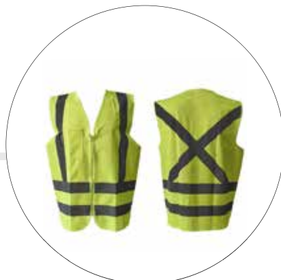
CHALECO REFLECTIVO CITYLUX VERDE 452051440481