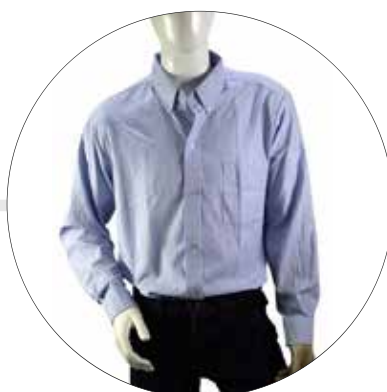
CAMISA EN OXFORD MANGA LARGA CAM-OXF-ML-HOM-K