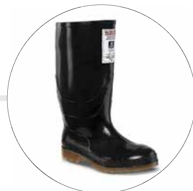
BOTA WORKMAN SAFETY WATERPROOF NEGRA 2440090