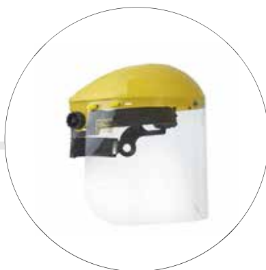
CARETA DE ESMERILAR 201801160452