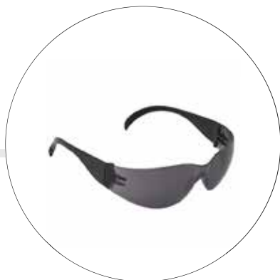
GAFAS DE PROTECCIÓN SPY 901259140245