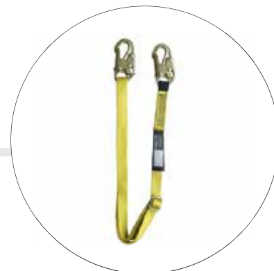
ESLINGA POSICIONAMIENTO 1.80M GRADUABLE 500843