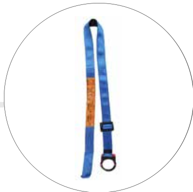
BANDA DE ANCLAJE DIELECTRICO GRADUABLE DE UNA ARGOLLALLA