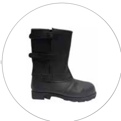
BOTA SOLDADOR SUELA VULCANIZADA 11256261