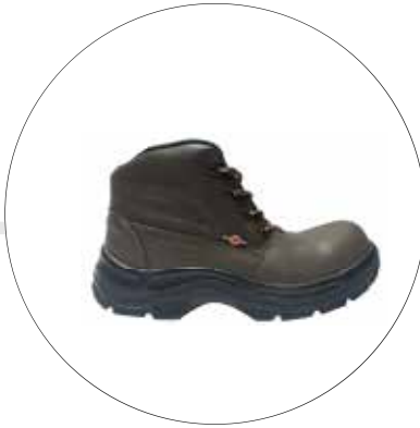
BOTA DE SEGURIDAD FENIX CAFE 53242515