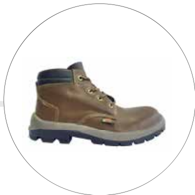
BOTA SEGURIDAD LABORAL SUELA EN POLIURETANO HUELLA PARA TORRES 24202341