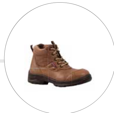
BOTA DE SEGURIDAD PARA DAMA TIPO INGENIERO 40062541