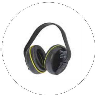
PROTECTOR AUDITIVO TIPO COPA SAMURAI