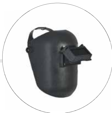
CARETA SOLDADOR APOLO 201400120060