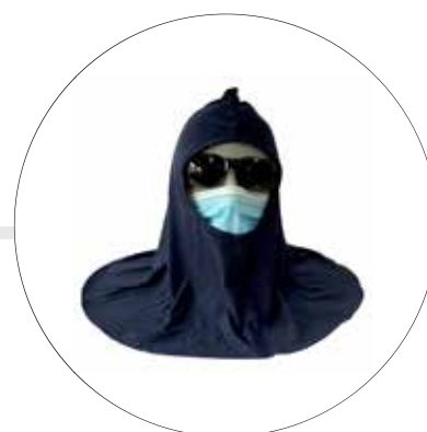
ESCAFANDRA EN ALGODÓN AZUL ES-AZ