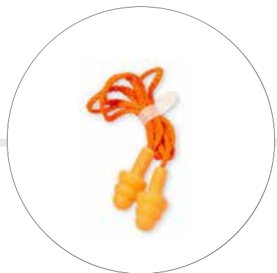
PROTECTORES AUDITIVOS DE INSERCIÓN